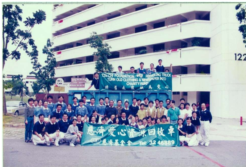
慈济 1999 年于裕廊东开设首个环保点。